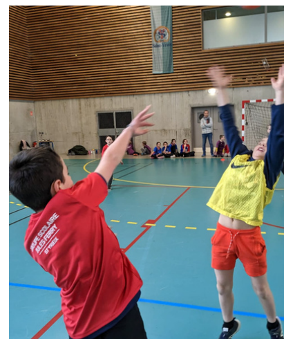
SAINT YRIEIX LA PERCHE