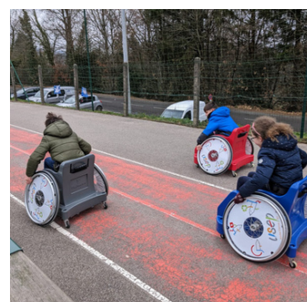
ECOLE DE BONNAC LA COTE