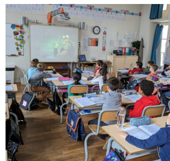
ECOLE JULES FERRY LIMOGES