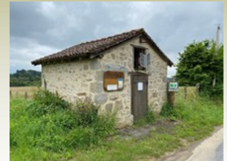
Plus petite bibliothèque de France: elle fait 9m 2 et propose 1800 livres.