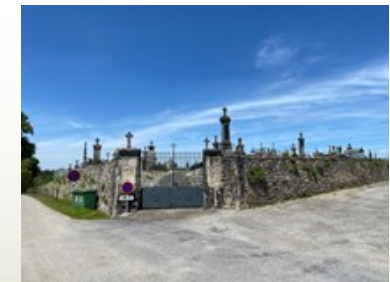
Le cimetière en haut du village.