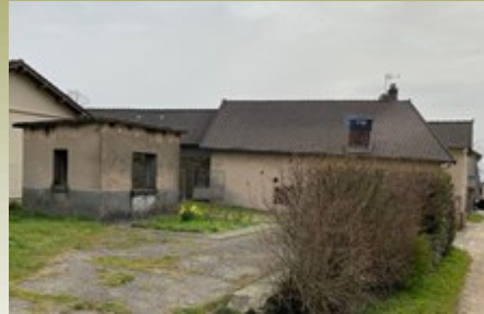
L'ancienne balance servait autrefois à peser les animaux pour la vente.