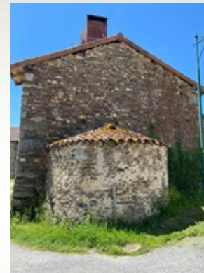
L'ancien four à pain de forme ronde.