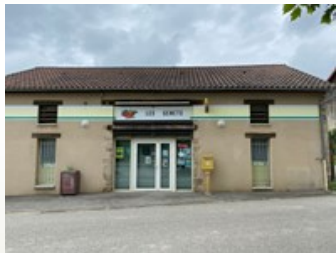
La supérette du village où il y a le bureau de poste.