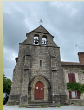
L'église du village avec son clocher et ses contreforts.