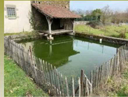
L'ancien lavoir où les femmes venaient laver leur linge avec un gros savon et taper dessus avec un péteux pour qu'il soit sec.