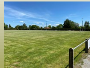
Le stade de football où on peut faire du sport.