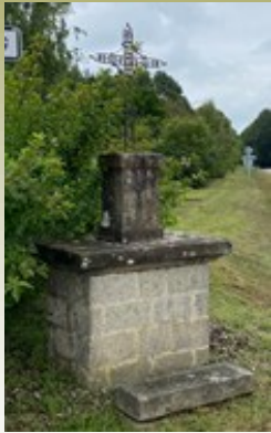
La croix au bord de la route.