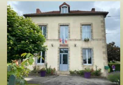
La mairie du village avec l'ancien puits juste devant.