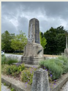
Monument aux morts.