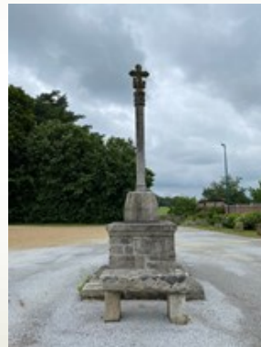
Croix en pierre.