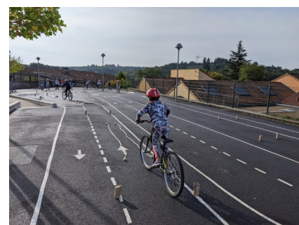
Ecole de Feytiat

Un partenariat avec le Vélodrome de Limoges Métropole à Bonnac permet l'apprentissage de la pratique du vélo pour une vingtaine de classes inscrites dans ce dispositif.