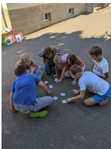
Ecole de Glandon

Des randonnées « collecte de déchets », débats mobilités actives, tri-déménageurs étaient entre autres proposés.