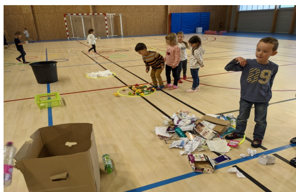
Ecole de Saint Gence

Dans le cadre de la JNSS 2021, une formation golf en partenariat avec le comité départemental 87 était également proposée aux enseignants.