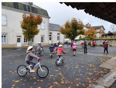
Ecole de Berneuil