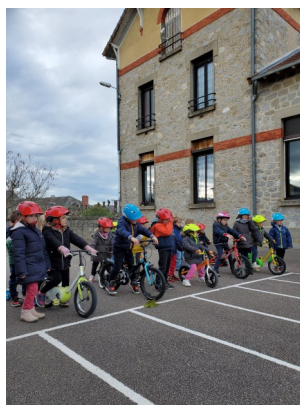
Ecole de Linards