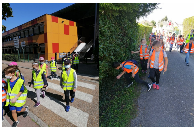
Ecoles de Panazol