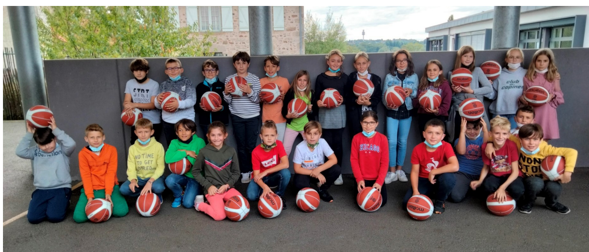
Classe de Feytiat , vainqueur de la E-Rencontre Cycles 3 2020-2021

Cross départemental Hors Temps Scolaire, le 9 mars 2022 à St Pardoux